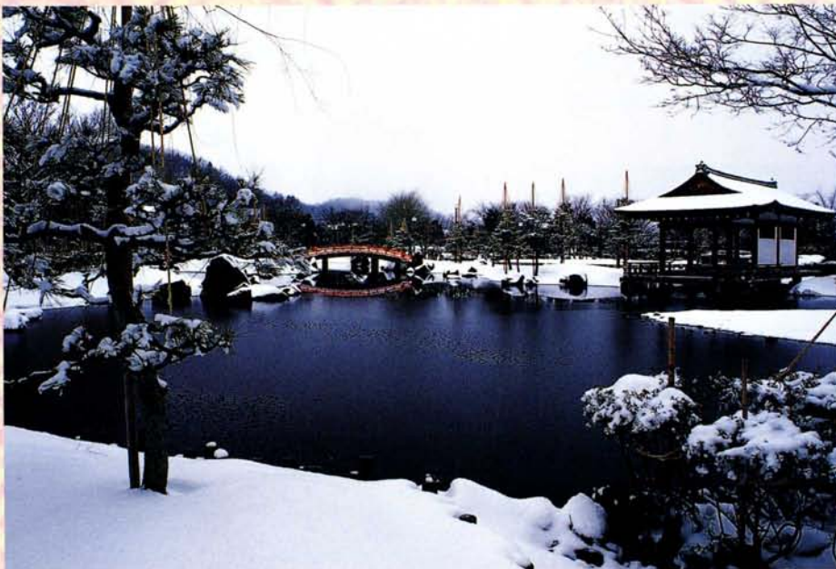
紫式部公園 武生ルネサンス「絵暦」より

小 日 こ け 塩 野 こ ま ぶ の 埋 野 に が や 松 む 杉 の へ る に 雪 む ら く