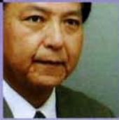
バリトン 富岡順一郎